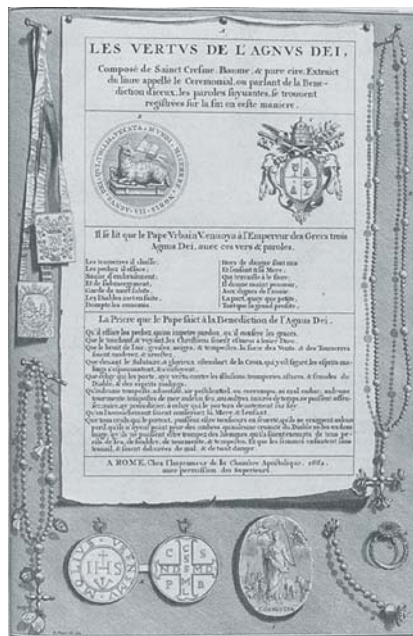
Publicatie van 'De Deugden van de Agnus Dei'

Met de komst van het Christendom bleek al snel dat dit diepgewortelde heidense geloof, maar moeilijk was uit te bannen. De christenen deden er alles aan om dit tot een ommekeer te brengen. Dus hebben ze in plaats van het 'lustrale'(of 'zuiverende') water het wijwater ingevoerd. In plaats van de 'amuleta' (amuletten) hebben zij de christenen geraden zich met het teken van het Kruis te wapenen, bijvoorbeeld met de hand op het voorhoofd, het lichaam of bijvoorbeeld op een wapen.